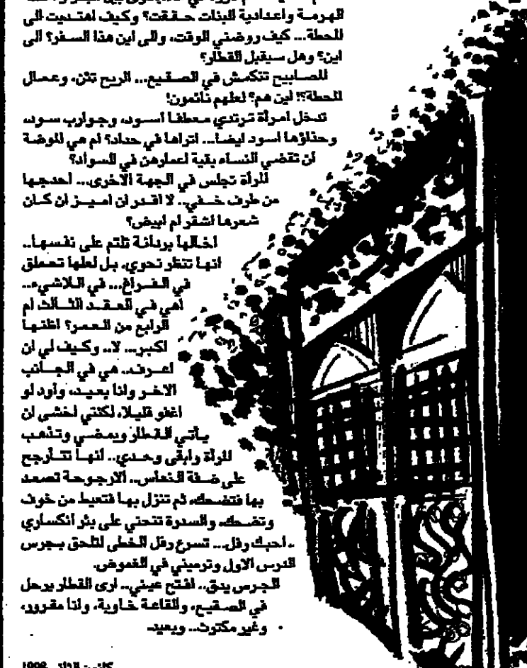
كنون لظني 1996